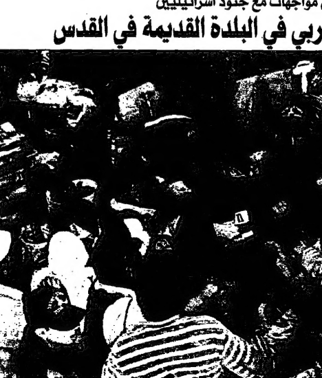
جنود اسرائيليون يمشون في شوارع القدس بعد احتلالها من قبل السلطة الفلسطينية وطردها من مكانة (م. رعد)

القدس - اير من يبحث نفيها هو على التوصل الى اتفاق حول الانسحاب يوم الثلاثاء 25 أيار (مايو) 1996.